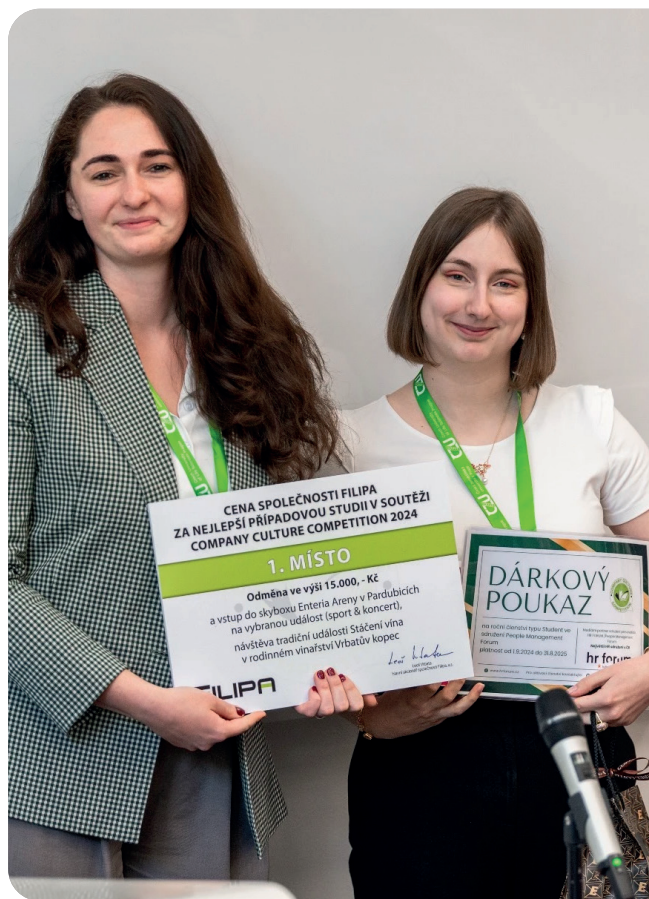
Vítězky 1. ročníku CCC

V roce 2024 se soutěže zúčastnilo celkem 96 studentů ve 32 týmech z různých vysokých škol a univerzit po celé České republice. „Úroveň účasti a profesionalita soutěžících nás minulý rok velmi mile